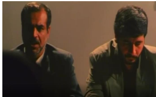
تصویر ۲) اعضای کمیته انضباطی دانشگاه با ریش و محاسن

در ادامه فیلم که پیمان و پرستو در اداره اجتماعی پلیس بازداشت می‌شوند، دو افسر پلیس با نام‌های حاج‌فتح و سیف‌السلام حضور دارند. آنان هردو دارای اسامی مذهبی بوده و دارای ریش و محاسن و بدنی هنجارمند و منطبق با گفتمان اصول‌گرایانه هستند. بنابراین به لحاظ رمزگان اجتماعی، می‌توان تعلق هر کدام از شخصیت‌های فیلم را به گفتمان خاصی نسبت داد.