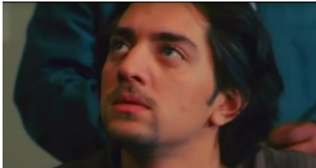
تصویر ۱۲) زاویه نگاه پیمان به مأمور اداره اجتماعی پلیس