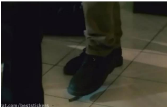
تصویر ۲۳) امتناع پیمان از قبول و کشیدن سیگار و له کردن آن در زیر پا