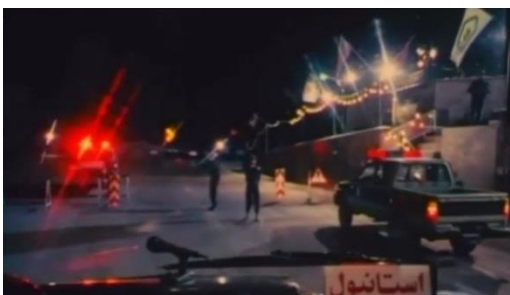
تصویر ۲۱) حضور پررنگ پلیس و خودروهای انتظامی