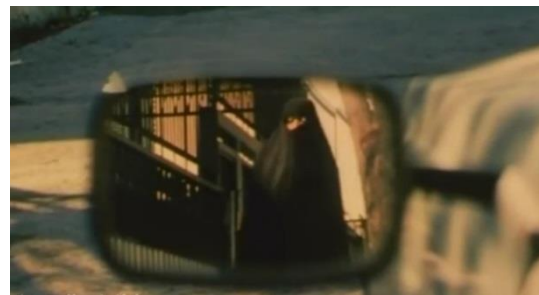
تصویر ۲۰) دیده‌بانی و مراقبت پلیس بر آمدو شد خانه پرستو

در ادامه فیلم و پس از آنکه پیمان موفق به فرار از دست مأموران انتظامی می‌شود، دیالوگی بین سیف‌الاسلام و حاج‌فتح شکل می‌گیرد که از بن‌مایه‌های ایدئولوژیک برخوردار است.