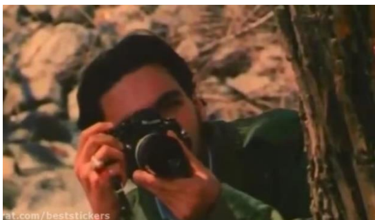
تصویر ۵) دیده‌بانی کارمند کمیته انضباطی دانشگاه از جشن تولد پرستو