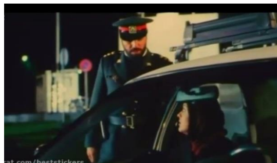
تصویر ۱۸) پلیس در حال مواخذه پرستو به ظن شُبگردی با پیمان