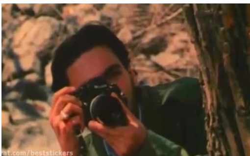
تصویر ۱۹) دیده‌بانی کارمند کمیته انضباطی دانشگاه حین جشن تولد

همانگونه که اشاره شد این دیالوگ اخیر حاج‌فتح اشاره به ویژگی مشاهده‌گری و نظارت دائمی قدرت بر سوژه‌ها در یک جامعه انضباطی دارد. نظارتی که همواره و بی‌وقفه بر سوژه‌ها اعمال می‌شود. کارگردان برای تأکید بر این ویژگی، به شکلی مکرر، صحنه‌هایی از خودروهای انتظامی با چراغ‌های گردان، مأموران انتظامی، ایست بازرسی‌های متعدد، بازداشتگاه و میله‌های اتاق‌های بازداشت و غیره را به نمایش می‌گذارد که همگی نشانگانی از دیده‌بانی مشرف به صحنه و حضور همیشگی و همه‌جایی قدرت را با خود به همراه دارند.