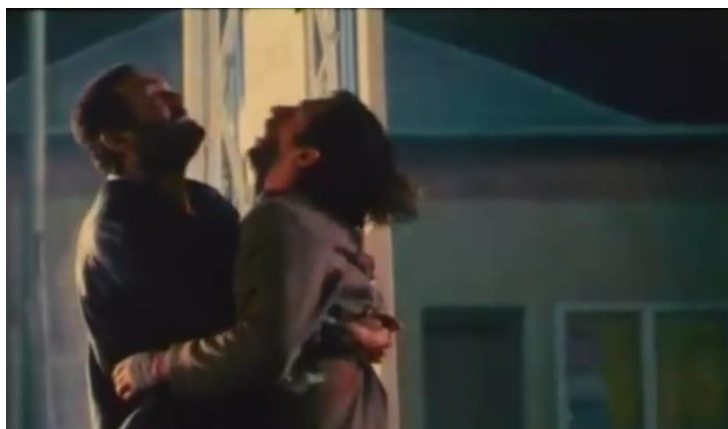
تصویر ۲۴) در آغوش کشیدن پیمان توسط حاج فتا پس از هدف گرفتن پیمان توسط مأموران و تیرخوردن حاج فتا در این صحنه

لیکن کارگردان در صحنه‌های پایانی و در سکانسی که مأموران پاسگاه مرزی پیمان را به گلوله می‌بندند، به ناگاه حاج‌فتحاح خود را به پیمان رسانده و وی را در آغوش گرفته و حتی در این راه به ضرب گلوله مأموران ترکیه از ناحیه پا زخمی می‌شود. این صحنه دلالتی ضمنی تأکیدی است بر این که بخشی از بدنه قدرت یعنی اصلاح‌طلبان به شکلی راستین خویش را مدافع امیال جوانان می‌پنداشتند.