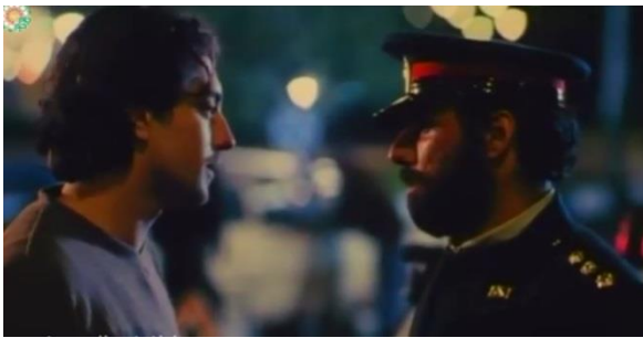
تصویر ۱۰) مواخذه پیمان از سوی مأمور ایست بازرسی حین شبگردی با پرستو

تناقض گفته‌های پیمان و پرستو، باعث سوءظن پلیس و بازداشت و تحویل آن دو به اداره اجتماعی پلیس می‌شود که این موضوع، مخالفت و مقاومت پرستو را در پی دارد. او در اعتراض می‌گوید: «مملکت قانون دارد. هرکی به هرکی نمی‌شود.» می‌توان این گفته پرستو را نوعی ارجاع به نظریه جورجو آگامبن ذیل مفهوم «شرایط استثنایی» قلمداد نمود. آگامبن می‌گوید: «در شرایط استثنایی، موقتاً قانون تعلیق می‌شود و نظر حاکم جای قانون را می‌گیرد. در این شرایط بدن حالت عریانی پیدا می‌کند برای اعمال قدرت حاکم.»