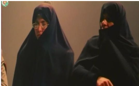
تصویر ۳) اعضای کمیته انضباطی دانشگاه با چادر و پوشش کامل