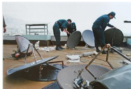
تصویر ۱۹- (راست) جمع‌آوری آنتن‌های ماهواره توسط نیروی انتظامی، اجرای این طرح از سال ۱۳۷۳ آغاز شد؛ تهران، ۱۳۸۵.