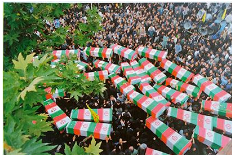
تصویر ۶- (راست) مجتبی کوچکی؛ تشییع پیکر ۵۰۰ تن از شهیدان دفاع مقدس، تهران؛ اردیبهشت ۱۳۸۱. تصویر ۷- (چپ) حسن سربخشیان؛ شیرین عبادی پس از دریافت جایزه صلح نوبل ۲۰۰۳، فرودگاه مهرآباد؛ ۲۳ مهر ۱۳۸۲.