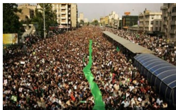
تصاویر ۲۸ و ۲۹- عکاس (شهروند- خبرنگار؟؟؟)؛ وقایع پس از انتخابات ۱۳۸۸، مکان؟؟؟.

در پی مفاهیم و معانی عکاسانه برآمدند، که این امر را هم می‌توان یک نوع حرکت اعتراضی به فضای بسته حاکم قلمداد کرد و هم اینکه سخنان انتقادی خود را در قالب عکاسی هنری و مفهومی ارایه می‌نمودند. این عوامل ناخواسته عکاسی ایران را به سمت برداشتن گام‌های اولیه برای نزدیک شدن به فضاهای پست‌مدرنیستی و شیوه‌های جهانی آن سوق داد، البته به این معنا نیست که عکاسی هنری و مفهومی ایران به درجه بالایی رسیده باشد و باز هم به این معنی نیست که عکاسان مستند فعالیتی نکرده باشند، بلکه از دیدگاه انتقادی و اعتراضی، جریان عکاسی مستند را با عکاسی از موضوعات مختلف اجتماعی توأم با شرایطی سخت‌تر و کُندتر، پیش بردند. هر چه به دوره دوم ریاست‌جمهوری دکتر احمدی‌نژاد و خصوصاً اتفاقات سیاسی و اعتراضات خیابانی پس از