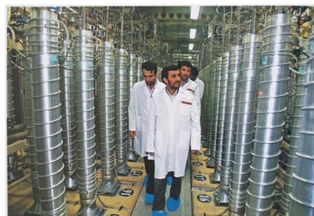
تصویر ۱۷- (راست) آرمان تیمور؛ آغاز نصب ۶ هزار سانتریفیوژ جدید با حضور رئیس‌جمهور، نطنز؛ ۲۰ فروردین ۱۳۸۷. تصویر ۱۸- (چپ) روح الله وحدتی؛ اجرای رزمایش موشکی پیامبر اعظم سپاه پاسداران؛ ۱۱ آبان ۱۳۸۵.