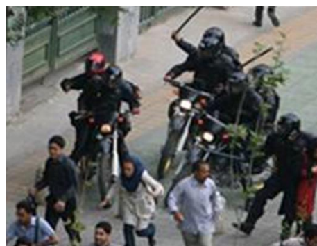
تصاویر ۲۶ و ۲۷- عکاس (شهروند- خبرنگار؟؟؟)؛ وقایع پس از انتخابات ۱۳۸۸، مکان؟؟؟.