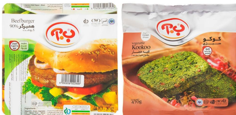
شکل ۱. بسته‌بندی برگزیده اولین رویداد سرو نقره‌ای، طراح: مهرزاد دیرین (URL1)