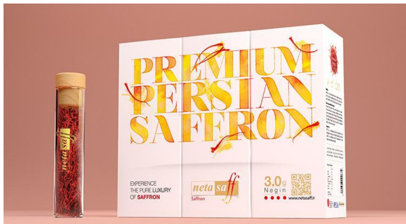
شکل ۵. بسته‌بندی برگزیده پنجمین دوسالانه سرو نقره‌ای، طراح: سیدمصطفی سیدابراهیمی