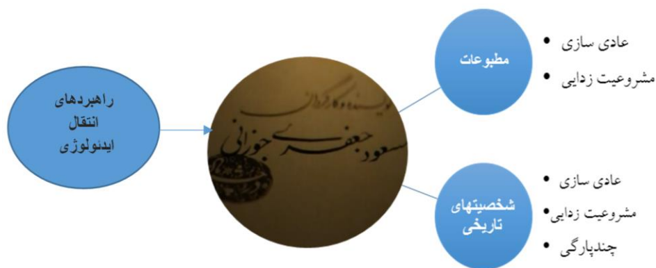
نمودار ۲. مدل نحوه انتقال ایدئولوژی در سریال در چشم باد

در بخش شخصیت‌های تاریخی نیز بازنمایی شخصیت میرزا کوچک‌خان با الف) راهبرد مشروعیت‌زدایی از حکومت پهلوی با استفاده از رمزگانی چون استبدادستیزی، محبوبیت در اذهان عمومی و اعتقادات مذهبی و عدم بازنمایی روایت‌های نامرجح و ب) راهبرد چندپارگی به‌وسیله تقبیح و مطلوبیت‌زدایی از دشمنان میرزا و ایجاد وحدت با استفاده از نماد پرچم و همراهی یاران انجام شده است که مخاطب را با شخصیت میرزا کوچک‌خان به‌عنوان قهرمان ملی‌مذهبی در مقابل رژیم پیشین همراه می‌کند. در اینجا متدین و آزادی‌خواه بودن میرزا کوچک‌خان به‌عنوان خوانش مرجح مورد نظر است و بین تدین و آزادی‌خواهی او پیوند برقرار است. در مورد رضاشاه نیز از راهبرد مشروعیت‌زدایی برای بازنمایی شخصیت مستبد، بی‌اراده و دست‌نشانده انگلیس بودن وی استفاده شده است. مرور تاریخی روایت‌ها نشان می‌دهد که فیلم ارتباط مستقیم عوامل خارجی و کشورهای استعماری در روی کار آمدن حکومت پهلوی را نشان می‌دهد و خواسته‌های استقلال‌طلبانه روزنامه‌نگاران را پشتوانه تاریخی انقلاب اسلامی و حکومت جمهوری اسلامی به‌عنوان وضعیت ایدئال به خدمت گرفته است. با این راهبردهای ایدئولوژیک، شرایط و رویدادهای تاریخی به‌شکل یک رویداد طبیعی بازنمایی شده و در راستای ایجاد خوانش مرجح و تثبیت ایدئولوژی جمهوری اسلامی و مشروعیت‌زدایی از نظام پهلوی صورت گرفته است (نمودار ۲).