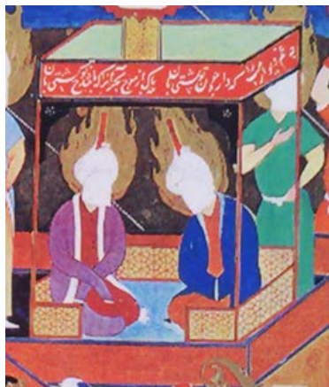
تصویر ۴. کشتی شیعه، شاهنامه شاه طهماسب (هوتن)، قزوین، ۹۳۷ ق، نیویورک، موزه هنر متروپولیتن، (بخشی از اثر) (شایسته‌فر، ۱۳۸۴: ۱۴۹)

اما نمونه منحصربه‌فرد این تصویر مربوط به نگاره کشتی شیعه از شاهنامه طهماسبی (هوتن) است که در اصلی‌ترین بخش اثر حضرت محمد(ص) و حضرت علی(ع) را در کنار هم ترسیم کرده است. در این تصویر آستین‌های هر دو بزرگوار به حدی بلند است که دستان مبارکشان را پوشانده است، اما آستین حضرت علی(ع)، طبق شیوه مرسوم در عرفان «لا»، به شکلی است که با قراردادن دست‌ها بر روی یکدیگر کلمه «لا» را به وجود آورده است. به نظر می‌رسد که نقاش سعی داشته با این حرکت ریشه‌های این تفکر را به امام اول شیعیان نسبت دهد (تصویر ۴).