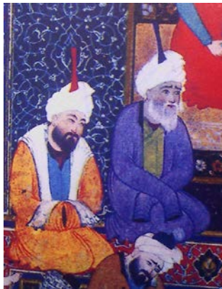
تصویر ۳. رسوایی در مسجد، دیوان حافظ، اثر شیخزاده (بخشی از اثر) (کریولش، ۱۳۸۴: ۵۹)

اما نمونه منحصربه‌فرد این تصویر مربوط به نگاره کشتی شیعه از شاهنامه طهماسبی (هوتن) است که در اصلی‌ترین بخش اثر حضرت محمد(ص) و حضرت علی(ع) را در کنار هم ترسیم کرده است. در این تصویر آستین‌های هر دو بزرگوار به حدی بلند است که دستان مبارکشان را پوشانده است، اما آستین حضرت علی(ع)، طبق شیوه مرسوم در عرفان «لا»، به شکلی است که با قراردادن دست‌ها بر روی یکدیگر کلمه «لا» را به وجود آورده است. به نظر می‌رسد که نقاش سعی داشته با این حرکت ریشه‌های این تفکر را به امام اول شیعیان نسبت دهد (تصویر ۴).