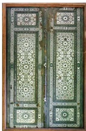
تصویر ۷. در منسوب به مقبره شیخ صفی اردبیلی (نگارنده)

زیباترین اثری که در آن از انواع شیوه‌های خاتم مربع استفاده شده در منسوب به مقبره شیخ صفی اردبیلی ۱ است (تصویر ۷) که تاریخ آن مربوط به سده دهم هجری قمری است. سطح در به طور کامل با نقوش متنوعی از شیوه‌های مختلف خاتم مربع و خاتم لایه‌ای پوشانده شده است و نشان از پیشرفت چشم‌گیر روش خاتم سنتی از زمان پیدایش نقش چهارقل بر رحل قرآن زین‌الدین حسن سلیمان اصفهانی در سده هشتم تا سده نهم هجری قمری دارد. در این بازه، هنر خاتم مربع از شیوه‌ای ساده و ابتدایی به روشی پیچیده و کامل با تنوع محصول قابل قبول بدل می‌شود.