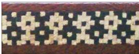
تصویر ۶. قطعه‌ای از خاتم مربع با نقش «مورد» در زمان معاصر. کلمه «لا» به صورت سیاه و سفید در این طرح قابل تشخیص است (نگارنده).

در شرح هنر خاتم مربع عده‌ای بر آن‌اند که شیوه‌ای ابتدایی از این هنر در زمان گسترش روابط ایران و چین در سده‌های هفتم و هشتم هجری قمری از چین به ایران راه یافته است؛ که ممکن است همین نقش شطرنجی سه‌تایی باشد. پس از این دوره با به‌وجود آمدن نقش موسوم به «مورد» تحول بزرگی در این هنر شکل می‌گیرد. نقش «مورد»، به لحاظ تکنیکی، ساده‌ترین شیوه اجرا بعد از نقش چهارقل در بین همه نقوش خاتم مربع را دارد. شاخصه اصلی این نقش تکرار پی‌پی کلمه «لا» است که در دو رنگ سفید و سیاه اجرا می‌شود و پُرکاربردترین و محبوب‌ترین نقش در خاتم مربع است (تصویر ۶).