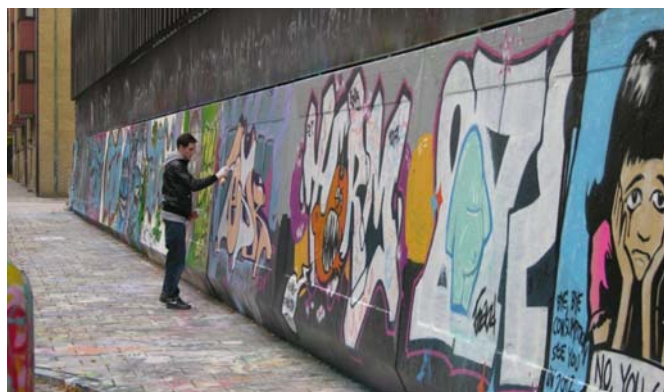
تصویر ۱. جوان سوئدی در حال تولیدگرافیتی بر روی دیوار یکی از مجتمع‌های مسکونی شهر مالمو - سوئد (۲۰۰۹)

شکل‌گیری فضاها امری کاملاً اجتماعی است. گرافیتی حاصل چنین تلقی‌ای از فضا در شهر، از مسائل شهر و آن چه در شهر می‌گذرد است. وارنر (۲۰۰۷: ۱۶۱) بر اهمیت فضا برای جوانان و نشان دادن فرهنگشان تأکید می‌کند و آن را محل منازعه میان فرهنگ رسمی و خرده‌فرهنگ جوانان می‌داند.