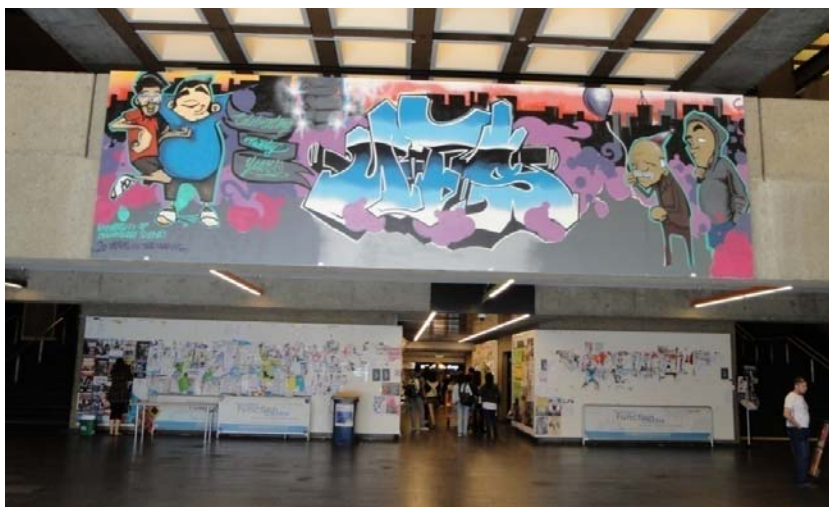
تصویر ۴. لابی دانشگاه یو. تی. اس. سیدنی، استرالیا

خودم تقدیر شجاعانه ۱ این را نشان دادم». او می‌گوید: «هر انقلابی را می‌توان نوعی جرم قلمداد کرد. مردمی که سرکوب می‌شوند یا متوقف می‌شوند، به یک مفر نیاز دارند، بنابراین، آنان روی دیوارها می‌نویسند- این آزاد است... هرچند، مردم نیز حق دارند تا از مالکیتشان حفاظت کنند. این یک تعارض انسانی است». در استرالیا مورخان هنر برخی از گرافیتی‌های محلی را آن‌قدر برخوردار از خلاقیت هنری دانسته‌اند تا آنها را به صورت جدی در میان هنرهای بصری رتبه‌بندی کنند. کتاب تاریخ هنر انتشارات دانشگاه آکسفورد به نام نقاشی استرالیا ۱۷۸۸-۲۰۰۰ ۲ به بحثی طولانی درباره جایگاه اساسی گرافیتی در فرهنگ بصری معاصر، من جمله آثار تعدادی از هنرمندان گرافیتی استرالیا، خاتمه می‌دهد و ارزش‌های این هنر را برمی‌شمارد. گرافیتی حتی به مکان‌های دانشگاهی نیز راه یافته است. در لابی یکی از دانشگاه‌های معتبر سیدنی با نام یو. تی. اس. (دانشگاه تکنولوژی سیدنی) مسئولان به نصب تابلویی گرافیتی اقدام کرده‌اند که به دانشجویان جدید خوشامد می‌گویند (نک. تصویر ۴).