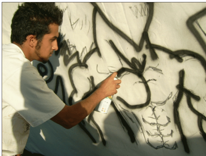
تصویر ۱۴. یکی از گرافرهای تهرانی در حال شرکت در مسابقه گرافیتی

اسکلت. از جمله عناصر به کار رفته در گرافیتی‌های ایران اسکلت است. نشانه اسکلت با مفهوم مرگ، ترس، خشونت و جنگ مرتبط است که به وضوح مفهومی سیاسی نیز به شمار می‌رود. اسکلت نشانه‌ای است که در کلیپ‌های موسیقی رپ و هوی متال نیز دیده می‌شود. دیو- شیطان. در بیشتر آثاری که با فرهنگ هیپ هپ (با موسیقی رپ و هوی متال) مرتبط است، نشانه شیطان یا دیو دیده می‌شود. البته این نشانه در برخی از آثار هم اشاره به وضعیت اجتماعی سیاسی دارد و با مفاهیمی مانند جنگ و صلح (نک. نشانه جنگ و صلح) مرتبط است (نک. تصویر ۱۴).