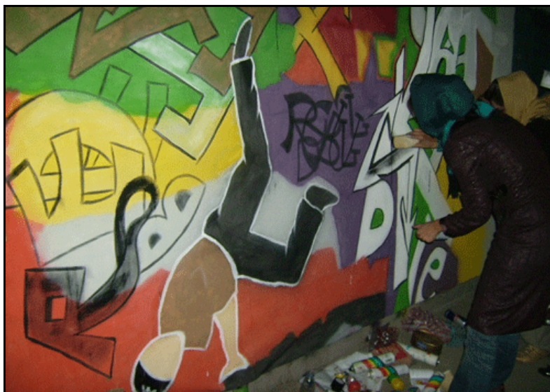
تصویر ۱۰. دختران و گرافیتی: در تصویر رابطه بین فرهنگ هیپ هپ، از جمله رقص رپرها، به خوبی دیده می‌شود.