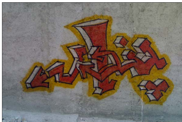
تصویر ۱۱. گرافیتی ترو آپ متعلق به پندار در شهرک اکباتان

هم به زبان انگلیسی و هم به زبان فارسی بسیار دیده می‌شود. نمونه‌های ارائه شده توسط هنرمندان گرافیتی شیراز بیشتر از نوع ترو آپ است (نک. به لینک مربوط).