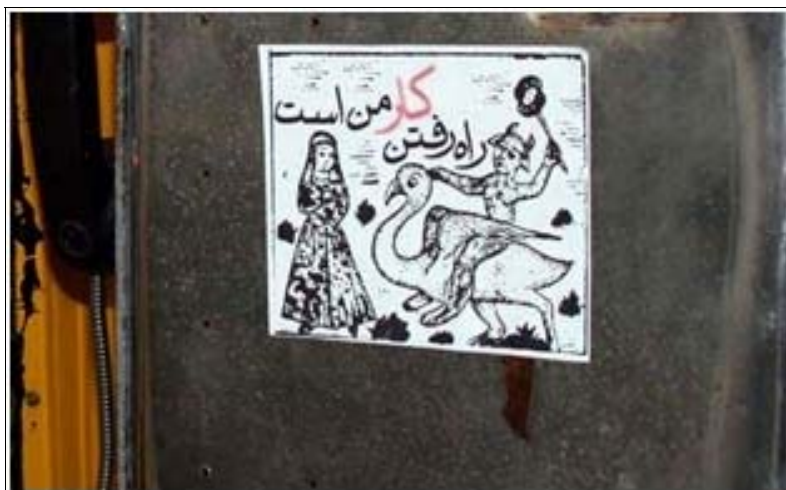
تصویر ۱۲. نمونه‌ای از برجسب روی دستگاه تلفن عمومی (تهران)

استنسیل ۱ : نمونه‌های استنسیل از ابتدای انقلاب تاکنون رایج بوده است. استنسیل هم از لحاظ سرعت عمل و هم قابلیت تکثیر از نمونه‌های سریع گرافیتی به شمار می‌رود.