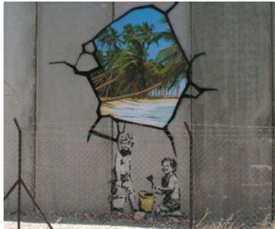
تصویر ۲. یکی از گرافیتی‌های مشهور بنکسی بر روی دیوار حائل

است (ویکیپدیا، ۲۰۱۰). استفاده از استنسیل در دوران انقلاب نیز کاملاً در ایران رایج بود. اولین استنسیل‌ها از تصاویر امام خمینی (ره) (نک. تصویر ۶) یا رهبران دیگر گروه‌ها در سطح شهرها به چشم می‌خورد و حتی امروزه نیز معدودی از آنها هنوز بر در و دیوارها برجای مانده است. در انگلستان، بنکسی (نک. سایت بنکسی در ضمیمه) شناخته‌شده‌ترین چهره این جنبش فرهنگی است که به منظور پرهیز از دستگیری توسط پلیس هویت خود را همواره به صورت رازآمیز پنهان می‌کرد. بسیاری از کارهای هنری بنکسی را می‌توان در گوشه و کنار دیوارهای لندن و حومه‌های آن دید، اگرچه آثار بنکسی فقط به لندن ختم نمی‌شود و در سراسر جهان، از جمله بر دیوارهای شهرهای خاورمیانه، هم می‌توان کارهای او را دید. یکی از این تصاویر نشان می‌دهد که دو کودک دارند از سوراخی که بر روی دیوار کنده‌اند، طرف دیگر را نگاه می‌کنند؛ آنان ساحلی زیبا را می‌بینند. در تصویر دیگری با همین مضمون باز کودکی دیده می‌شود که آن سوی دیوار را کوهستانی می‌بیند! کودکان فلسطینی آن سو را ساحلی زیبا می‌بینند و کودکان اسرائیلی سرزمینی کوهستانی. از سال ۲۰۰۰، نمایشگاه‌هایی برای گرافیتی در سراسر جهان برگزار شده و آثار هنری اخیر گرافیتی مورد توجه منتقدان هنری قرار گرفته است.