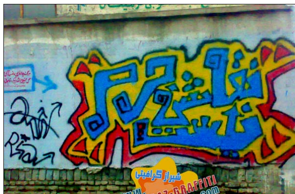
تصویر ۹. نمونه‌ای از گرافیتی جوانان شیرازی با نام «نقاشی جرم نیست»

در بهمن ماه سال ۱۳۸۶، نخستین جشنواره گرافیتی با عنوان «بمب در پیاده‌روی فرهنگی» از طرف جمعی از گرافرهای ایرانی در تهران برگزار شد. در این جشنواره نزدیک به ۱۸۰ استیکر (برچسب) از هنرمندان معروف گرافیتی در کشورهای گوناگون دنیا به ایران ارسال شد و به همراه برچسب‌هایی از گرافرهای ایرانی در اماکن عمومی نظیر میدان ونک و چهار راه ولی‌عصر چسبانده شد. در عبارتی که در یکی از گرافیتی‌های شیراز آمده است، با عنوان «نقاشی جرم نیست» طرز تلقی جوانان نسبت به این هنر بیان شده است. این گرافیتی درست بر روی دیواری ایجاد شده که بر روی آن با نوعی استنسل از سوی اماکن قانونی نوشته شده است که نصب هرگونه آگهی و یا نقاشی دیواری ممنوع است و تعقیب قانونی دارد! این نمونه‌ای از همان تلقی لوفور (۲۰۰۹) در این باره است که چگونه فضا به محلی برای نمایش تعارض در می‌آید. از سویی این فضا متعلق به حکومت است و حق دارد که نوشتن بر روی آن را به هرکسی که می‌خواهد واگذار کند. و از دیگر سو، جوانانی هستند که این دیوار را متعلق به خود می‌دانند و تلاش می‌کنند که آن را به مثابه بخشی از فضای زندگی روزمره خود نشان دهند. این تلقی در نمونه دیگری از گرافیتی‌های مشهدی دیده می‌شود که بر روی آن نوشته «ما بچه‌های خیابونیم، آشغال سری به ما بزن». تمامی عبارت با رنگ سیاه استنسیل شده است به جز کلمه «آشغال» که به رنگ قرمز است و تعارض را کاملاً نمودار می‌سازد.