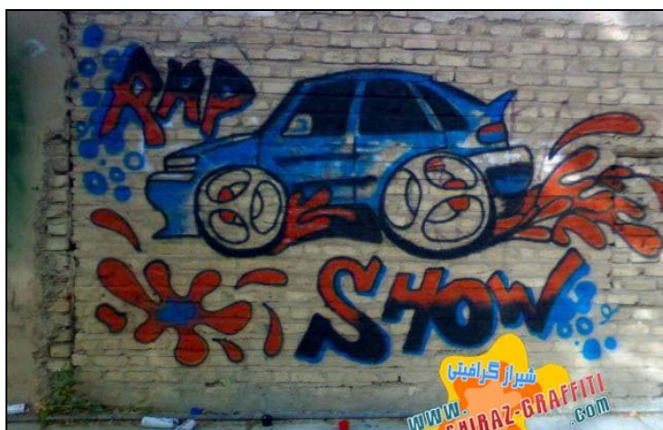
تصویر ۱۵. رابطه میان موسیقی رپ (فرهنگ هیپ هپ) و گرافیتی، نمونه‌ای از گرافهای شیراز

اتومبیل. در گرافیتی‌های ایرانی نه تنها اتومبیل یکی از نشانه‌های مورد توجه جوانان است، بلکه در تصویر نمونه گرافیتی از شیراز، رابطه گرافیتی و موسیقی رپ نیز تصویر شده است (نک. تصویر ۱۵).