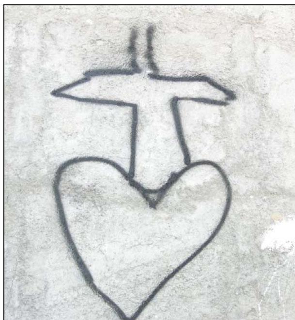
تصویر ۵. اشکال سنتی گرافیتی: خنجر و قلب - بخش قدیمی شهر لار (عکس از نگارنده، ۱۳۸۷)

اما شاید اشکال خاص گرافیتی که در جریان و دوران پس از انقلاب شکل گرفته از اولین تجربه‌هایی باشند که به گرافیتی به معنای امروزی آن نزدیک‌تر می‌شوند. ساده‌ترین شکل گرافیتی که در جریان و دوران پس از انقلاب تولید شد، استنسیل کردن بود. تولید استنسیل به‌سادگی امکان‌پذیر است و یکی از اشکال شناخته شده گرافیتی در جهان به شمار می‌رود. این کار در ایران با استفاده از تلق‌های فیلم‌های رادیوگرافی که تصویر مورد نظر از درون آن بریده شده بود، صورت می‌گرفت. با استفاده از قلم موی رنگی یا اسپری رنگ، استفاده از این استنسیل‌ها به‌سادگی امکان‌پذیر بود. هنوز برخی از نمونه‌های این تصاویر بر در و دیوار شهرها از آن روزگار باقی مانده است. اشکال دیگر گرافیتی به صورت نقاشی‌های دیواری بزرگی است که بر روی دیوارهای شهر خودنمایی می‌کند و در واقع شبیه پوسترهای سیاسی در مقیاس بزرگ