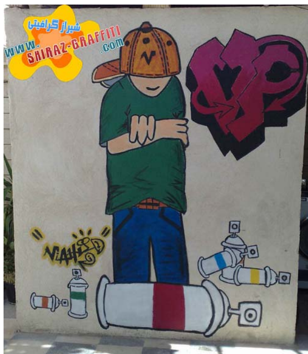
تصویر ۸. اثری از گرافرهای شیرازی: گرافیتی عنصری از سبک زندگی جوانان

پارادایم نظری جهانی شدن و یا جهانی - محلی شدن قابل فهم است. بنابراین، فرهنگ بخشی از جوانان ایران متأثر از همین فرهنگ «جوانان جهانی» است که فرهنگی «بریکوله» و به گفته شایگان «مرفع‌بندی» شده را تشکیل می‌دهد و به هویتی «چهل تکه» می‌انجامد. شهابی (۲۰۰۶) این هویت چندرگه (هایبرید) را در مورد جوانان ایرانی نشان داده است. گزارش جالب توجه عصر ایران (انواری، ۱۳۸۷) از گروهی از جوانان با عنوان «تکنو، گرافیتی و اسکیت‌برد» ارتباط موسیقی، هنر و ورزش‌های خاص بخشی از جوانان را نشان می‌دهد که کاملاً با مفهوم پساخرده‌فرهنگ و فرهنگ جوانان جهانی همخوان است. اگرچه بیشتر نمونه‌های این نوع گرافیتی را در تهران می‌توان دید، با این حال در دیگر شهرهای ایران (نظیر کرج، مشهد، شیراز و تبریز) نیز از این نوع گرافیتی‌ها می‌توان یافت.