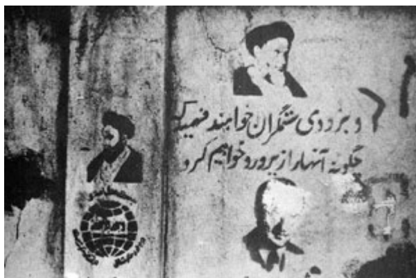
تصویر ۶. نمونه‌ای از گرافیتی دوران انقلاب (سبک استنسیل)

است. اخیراً هم نمونه‌هایی از این نوعی نقاشی‌های دیواری راه، که توسط شهرداری در سطح شهر ایجاد شده است، می‌توان دید که هدف از آن آموزش شهروندی یا نوعی پروپاگاندا است.